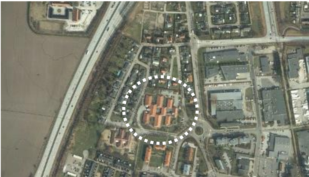
Översiktskarta med området som omfattas av detaljplanen i vit cirkel