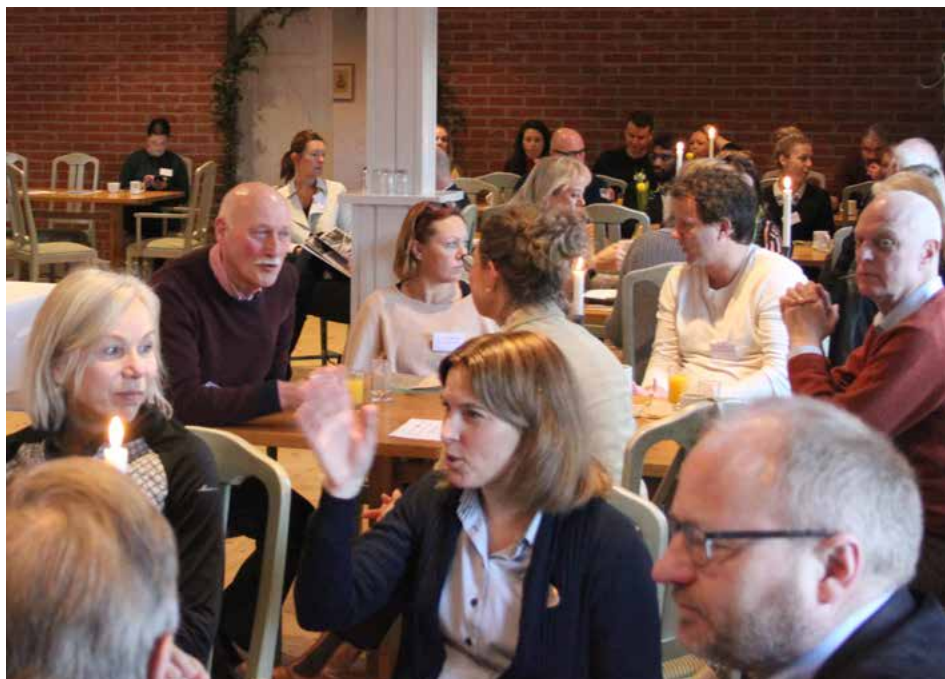
Näringslivsfrukosten 24 februari.