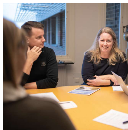
Företagslotsen erbjuds numera digitalt.