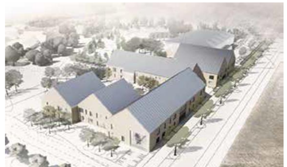
Tidigt skissförslag på ny skola i Östra Höllviken