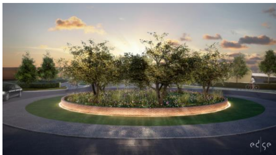
Visionsbild cirkulationsplats N infarten

Investeringsprojekt N infarten beräknas utgiften uppgå till 17,0 Mkr 2021 mot budgeterade 22,0 Mkr. Upphandlingen av entreprenaden blev lägre än beräknat. Bidrag erhålles från Skånetrafiken samt statsbidraget för utökad bostadsbyggande med 12,0 Mkr. Prognos nettoutgift 2021, 5,0 Mkr.