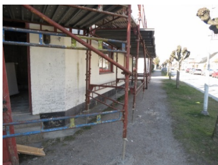
Byggställning där offentlig mark används.

Vid uppställning av bodar, ställningar, upplag, mobilkran, containrar eller liknade ska i första hand tomtmark användas. Om detta inte är möjligt så kan offentlig mark användas. Plank och bodar, m.m. kan också kräva bygglov. Byggbelamringen får inte dominera eller förfula centrala platser, gågator och torg. Varje miljö har sina krav på hur placeringen ska vara med hänsyn till brandrisk, hälsosynpunkt, säkerhetssynpunkt, framkomlighet och gatuunderhåll.