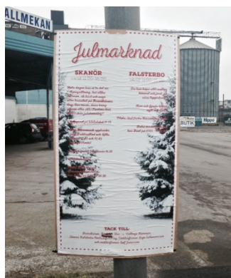
Affisch på lyktstolpe

Affisivering får endast utföras på förutbestämda platser, vilka anges i ansökan. Affischer får endast förekomma på lyktstolpar på kommunala vägar. Max 10 st i varje ort.