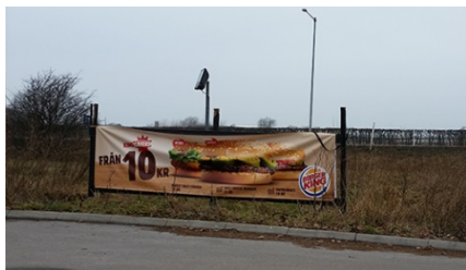
Exempel på banderoll.