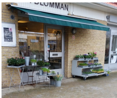
Vid placering av varor på allmän mark utanför butik krävs tillstånd från Polisen.