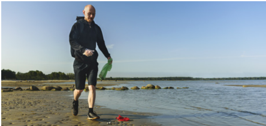
Passa på att plogga under Löparfesten i Vellinge.

Du håller det nya nyhetsbrevet Rent naturligt från Vellinge kommun i din hand. Här bjuder vi på bra tips för säsongen och användbar information som rör ditt hushållsavfall, vatten och avlopp.