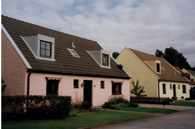
Under 1980-talet dominerar pastellfärger oftast på putsade eller slammade fasader eller ljusröd tegel med vita snickerier.