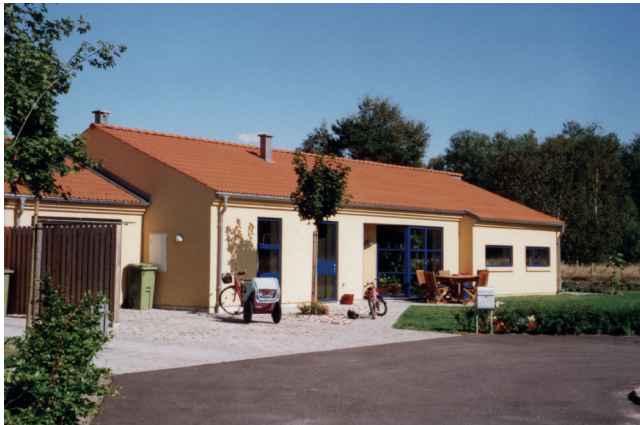
1990-talets bostadsområden har ofta en mer färgstark och varierad färgsättning.

Det krävs bygglov för att färga om byggnader eller byta fasad- och takmaterial enligt Plan- och bygglagen (PBL) inom detaljplanlagt område. Undantag ges för en- eller tvåbostadshus vad avser ändring av färgsättning "...om byggnadens karaktär därigenom inte ändras väsentligt..." enligt 9 kap, 2§, punkt 3 c, PBL. Vad innebär då egentligen begreppet väsentligt? Det är ett faktum att det finns få juridiska överprövningar att utgå från och att det därför är av värde att byggnadsnämnden och bygglovsenheten kan ge så entydiga svar som möjligt vid förfrågningar. Materialbyten kräver dock i allmänhet bygglov – ring bygglovsenheten och informera er!