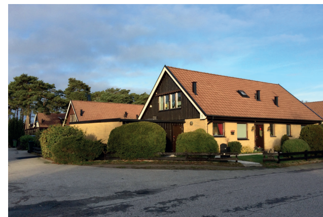
1970-talets dyrkan av underhållsfrihet och rationalitet visade sig i rena gula eller mörkt rödbruna tegelfasader. Snickerierna var laserade mörkt bruna.

Hus i grupp - möjlig kulörändring utan bygglov