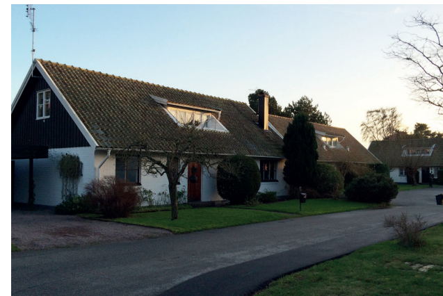
1960-talets småhus var ofta i rött tegel eller vitmålade tegelfasader med bruna snickerier.

Varje decenniums karaktär och färgsättning framträder tydligt efter vår genomgång. 1960-talets småhus var ofta i rött tegel eller vitmålade tegelfasader med bruna snickerier, medan 1970-talets dyrkan av underhållsfrihet och rationalitet visade sig i rena gula eller mörkt rödbruna tegelfasader. Snickerierna var förstas laserade mörkt bruna. Under 1980-talet dominerade pastellfärger oftast på putsade eller slammade fasader eller ljusrött tegel med vita snickerier. 1990-talets bostadsområden har ofta en färgstarkt och varierad färgsättning. Dessa olika utgångspunkter ger olika förutsättningar. Färgsättningen från ett visst decennium hänger naturligtvis samman med hur man utformade byggnadsdelarna under samma tid. En byggnad ingår i en större helhet. Det blir därför lätt fel om t ex ett 70-talshus målas om i 80-talsfärger och vice versa.